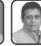
શ્રી જયંતીબાઈ વિરજી સત્રા ભચાઈ